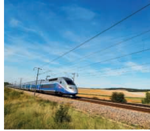
Un train sur ses rails.

La trajectoire de l'objet est un ..... : son mouvement est ..... .